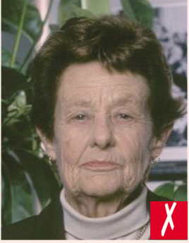
Arka plan yanlış