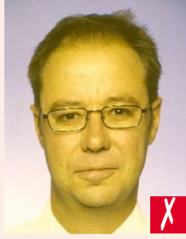
Nötr olmayan ten rengi