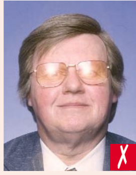
Flaş gözlük camını parlatmış