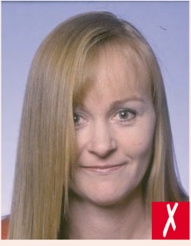
Saçlar gözü örtmüş