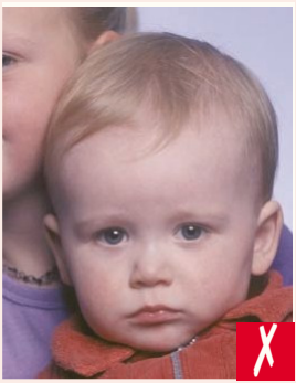
Başka biri görünüyor