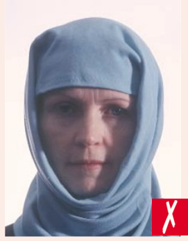
Yüze gölge vurmuş