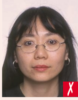
Çerçeve gözü kapsıyor