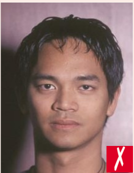
Başın arkasında gölge