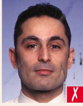
Mürekkep izi ve darbeleri