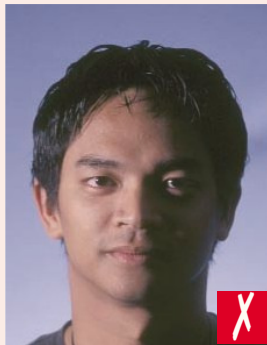
Yüzün etrafında gölge