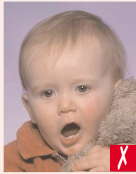
Ağız açık, oyuncak ve baş hizası fotoğrafın tamamını kapsamış