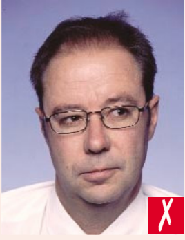
Başka noktaya bakma